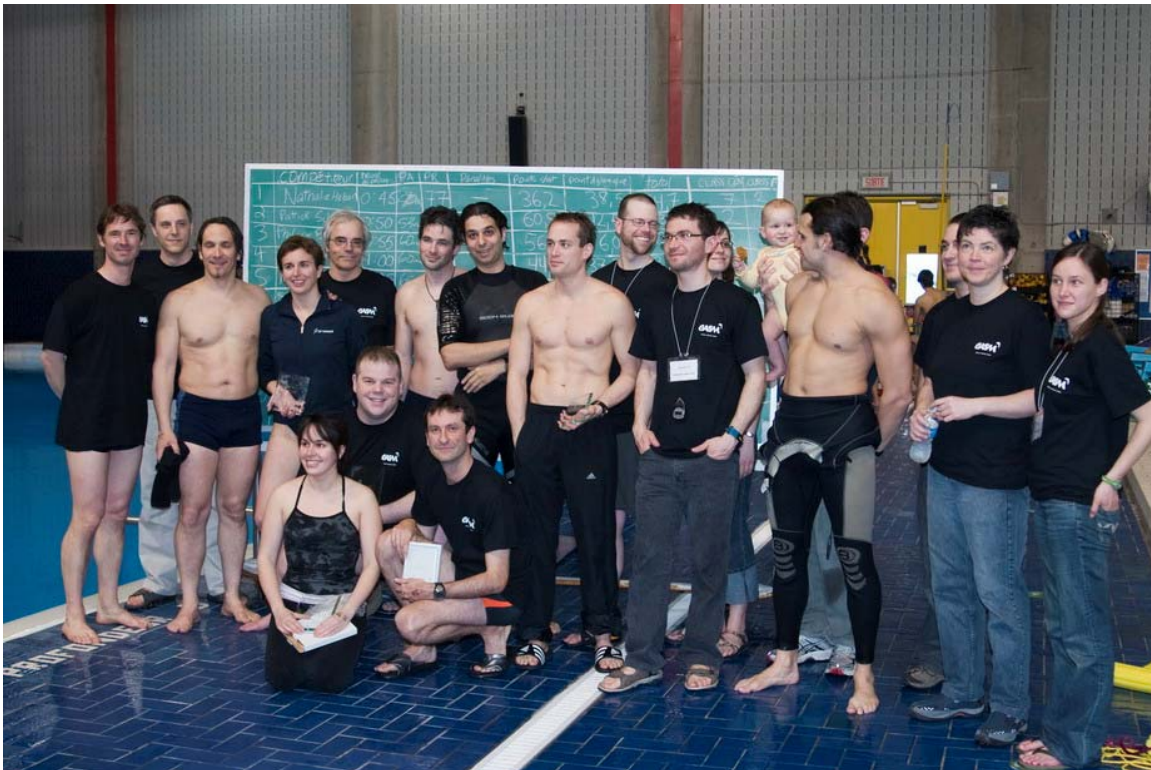
Lors de la 4 e coupe de Montréal, 5 avril 2008

Organisé par le Club d'Apnée Sportive de Montréal (CASM)